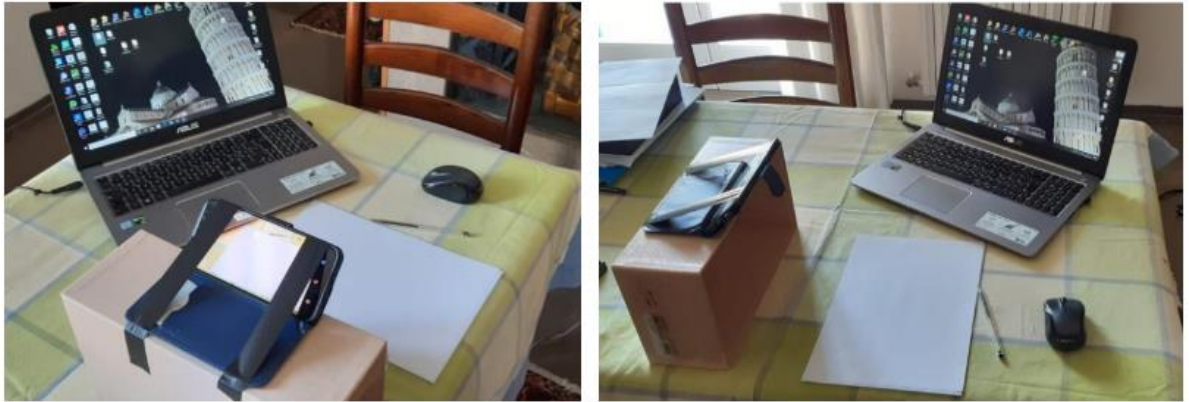
Esempio di posizionamento del PC e dello smartphone (il supporto utilizzato in questo caso è una semplice scatola da scarpe con lo smartphone fissato con nastro adesivo).